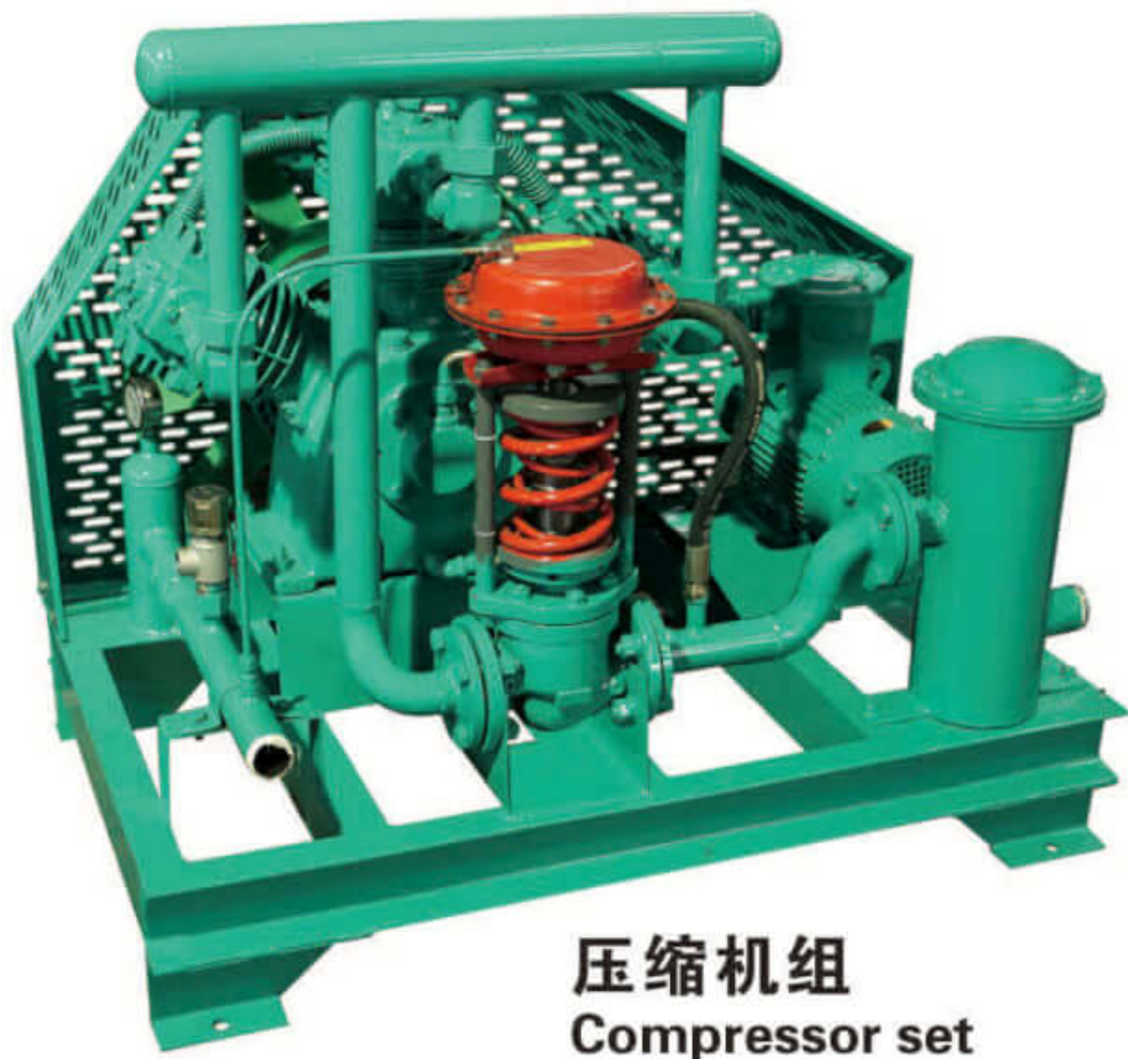
压缩机组 Compressor set