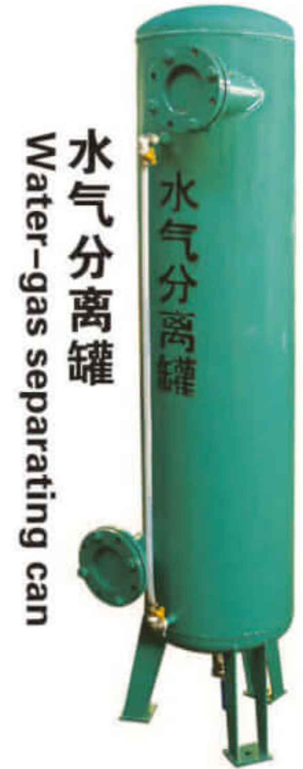
水气分离罐 Water-gas separating can