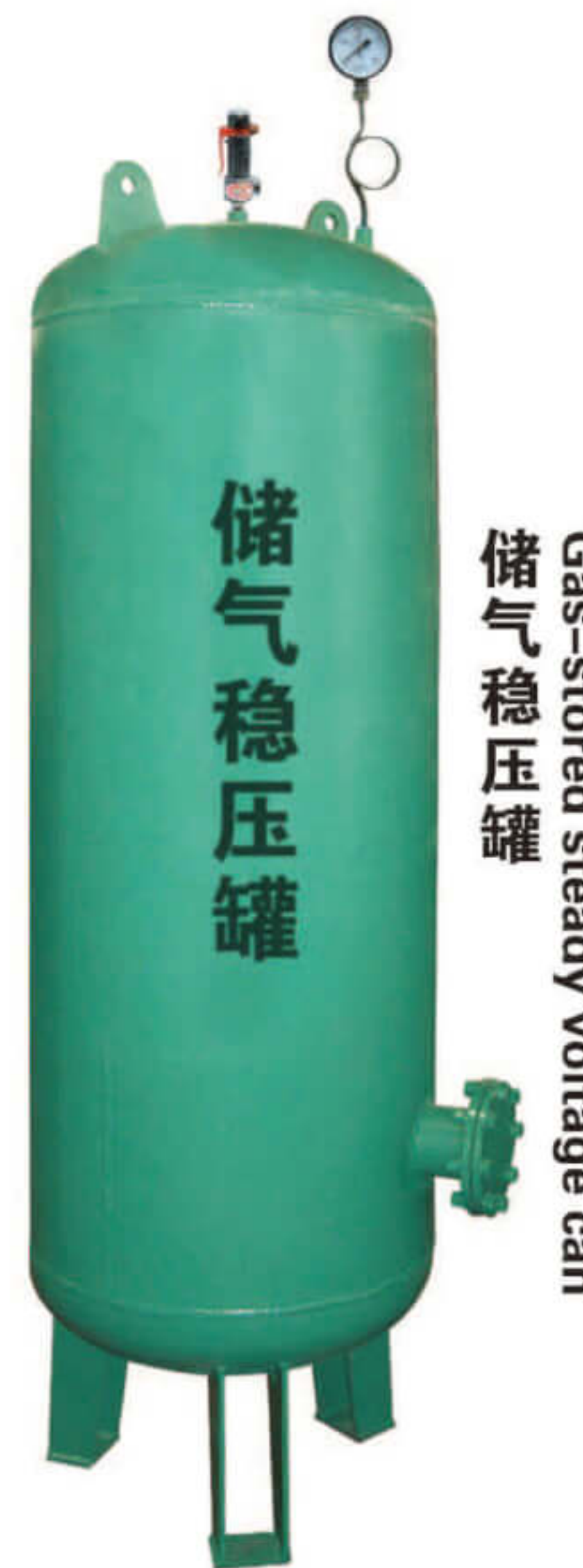
储气稳压罐 Gas-stored steady voltage can