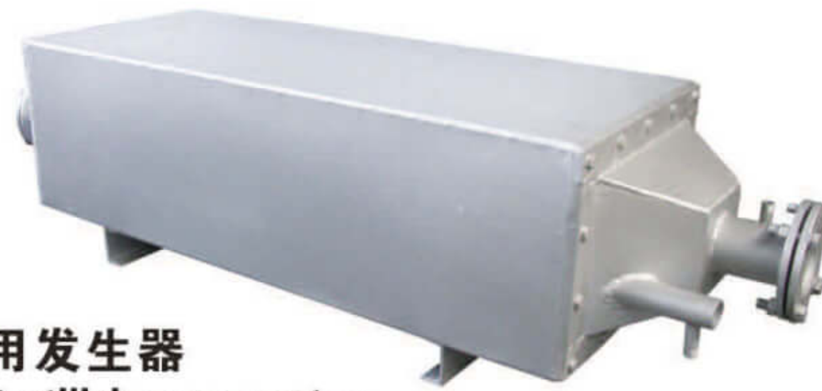
余热利用发生器 Afterheat utilizing generator