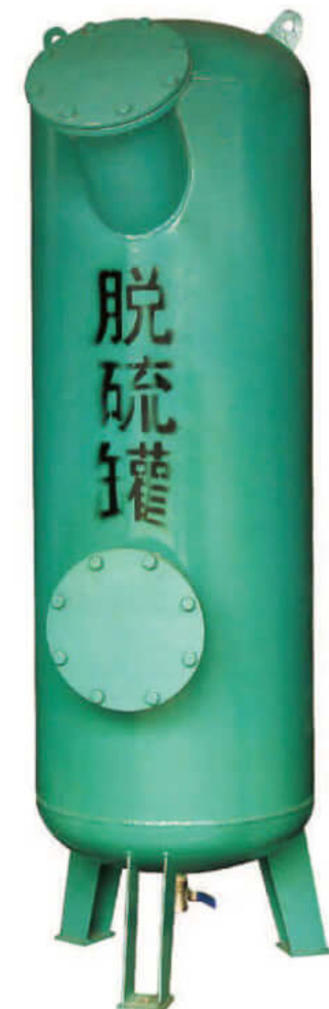
脱硫罐 Desulphurization can