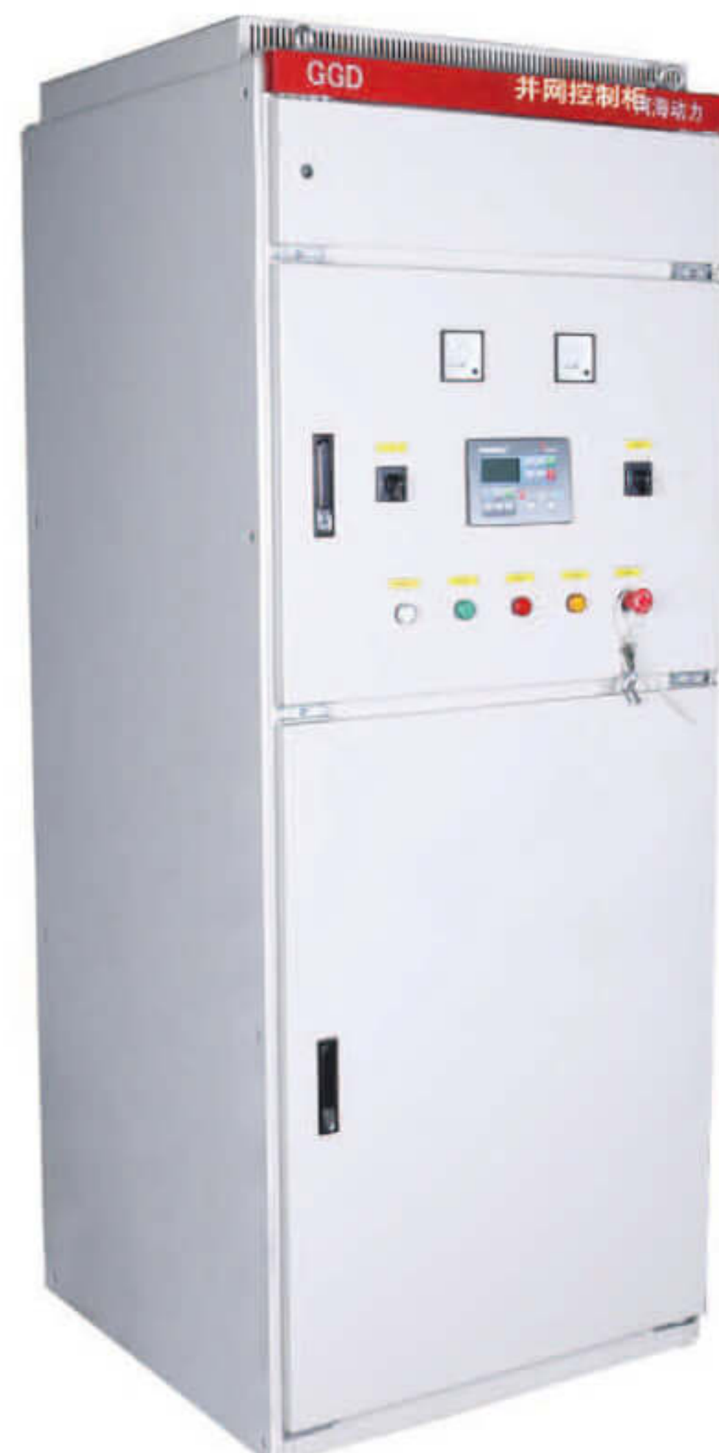
电控柜 Electric control box