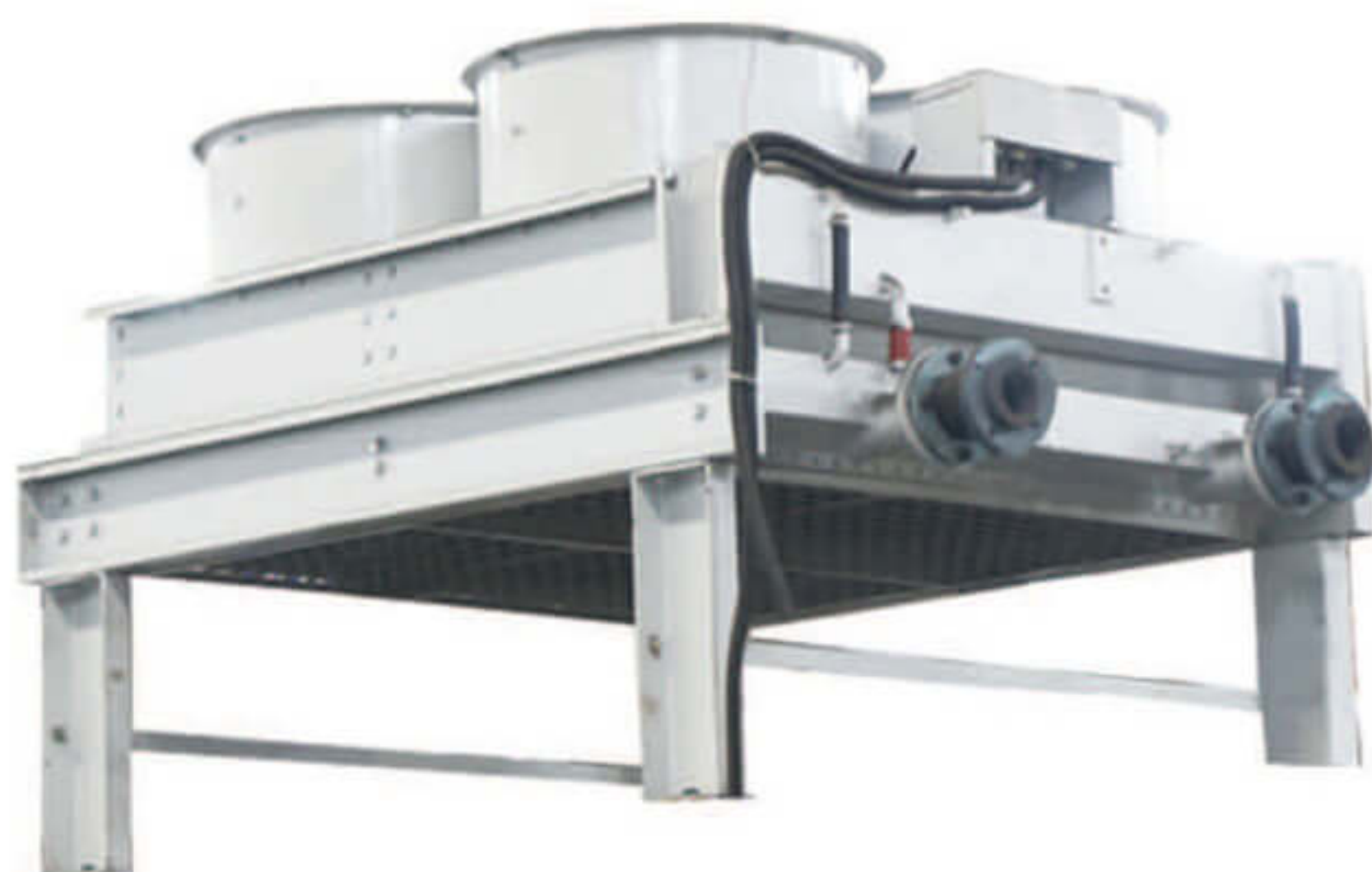
冷却水箱 Cooling water tank