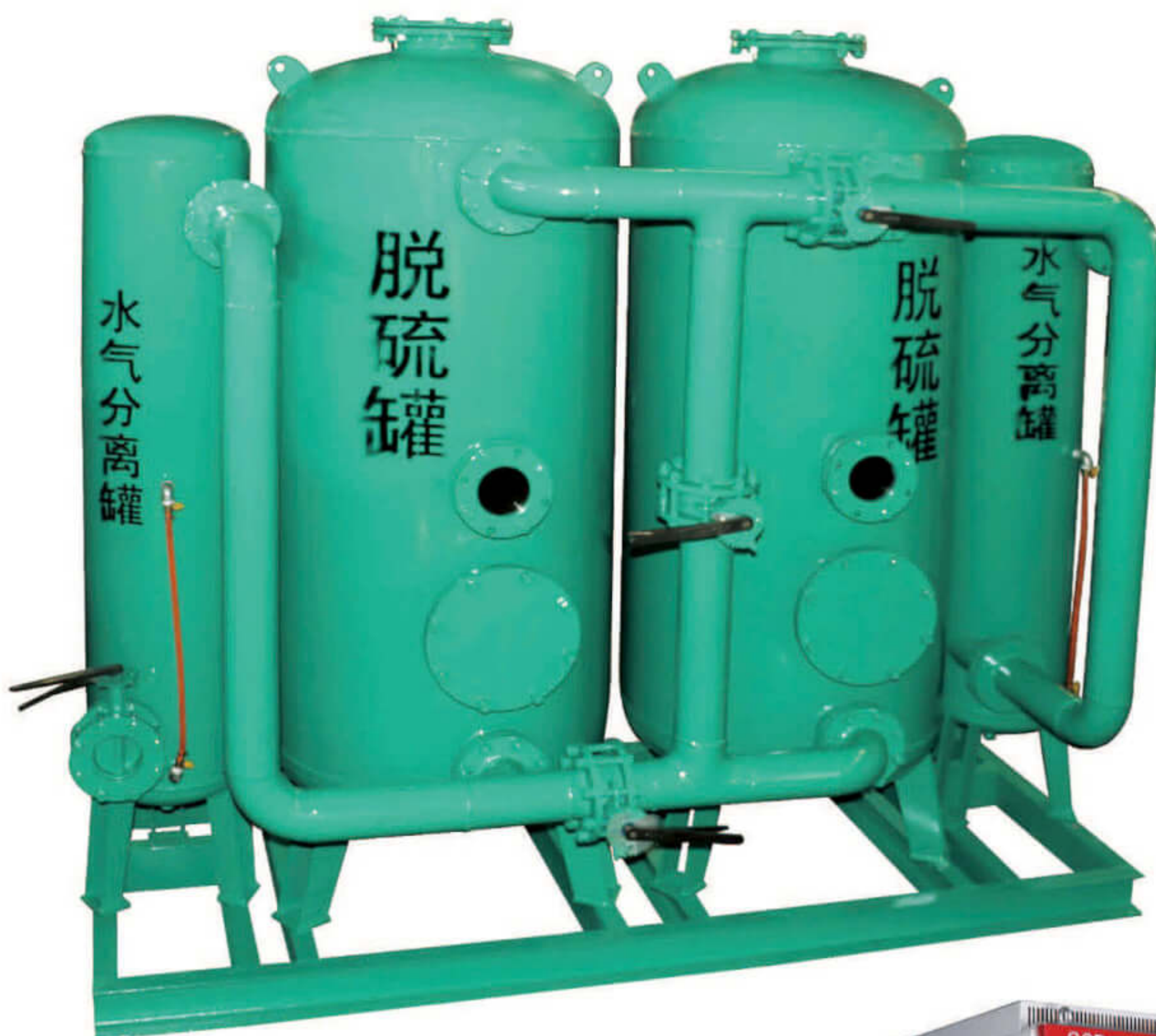
脱硫系统 Desulphurization system