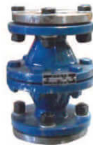
阻火器 Flame arrester